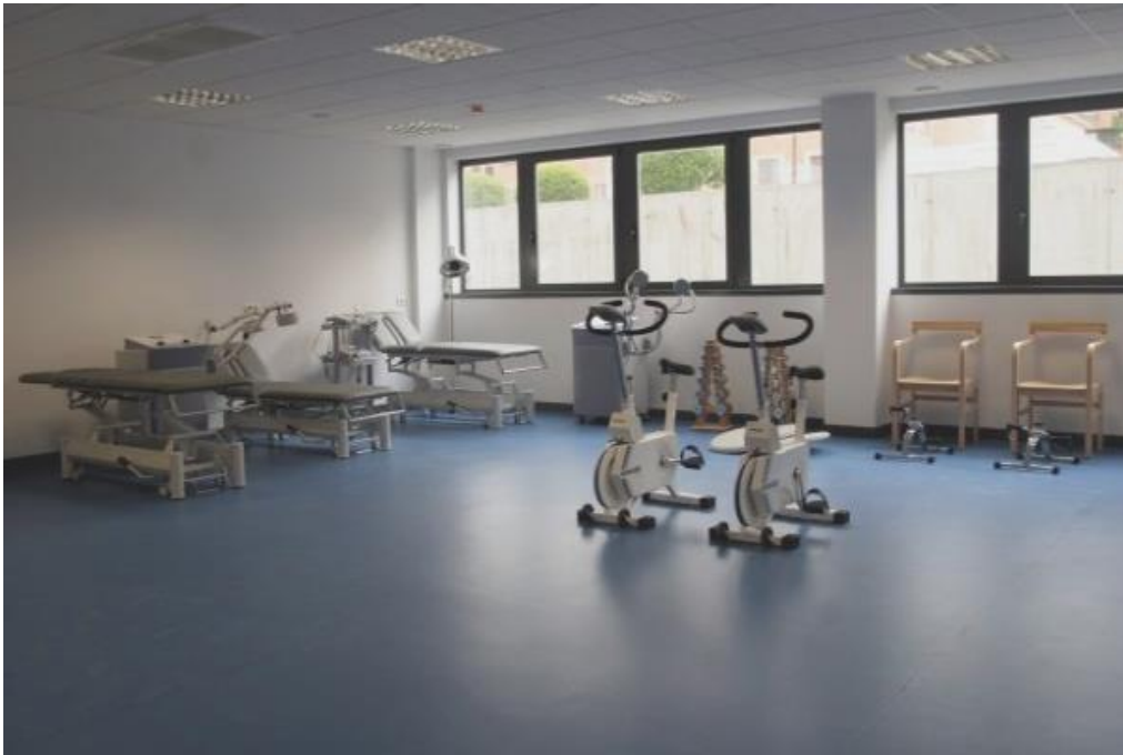
Sala Rehabilitación C.A.R.P.A.

tratamiento, en un mismo acto asistencial ambulatorio, con el objetivo de evitar demoras innecesarias. Además, el centro acoge otras consultas de especialidades que trabajan con los procedimientos tradicionales, así como rehabilitación para pacientes no ingresados.