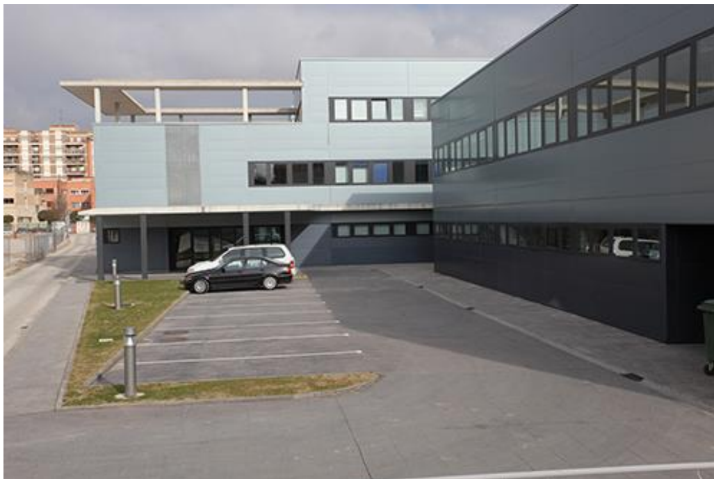
Parking del C.A.R.P.A.

El CARPA cuenta con parking en planta cero y sótano.