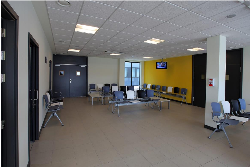
Sala de consultas C.A.R.P.A.

La organización y estructura se distribuye de la siguiente manera: