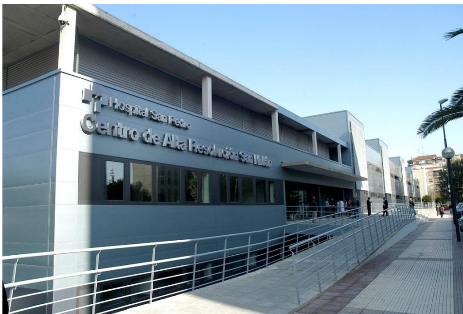
Puerta de acceso al C.A.R.P.A.

El edificio ocupa 12.000 metros cuadrados. En el vestíbulo principal hay un punto de información a disposición de todos los usuarios. Es un centro sanitario de atención diurna, atendido por unos 200 profesionales que alberga las consultas externas y otros procesos asistenciales como cirugía menor, rehabilitación y la unidad de atención a la mujer Sana. Está previsto que atienda unas 100.000 consultas al año.