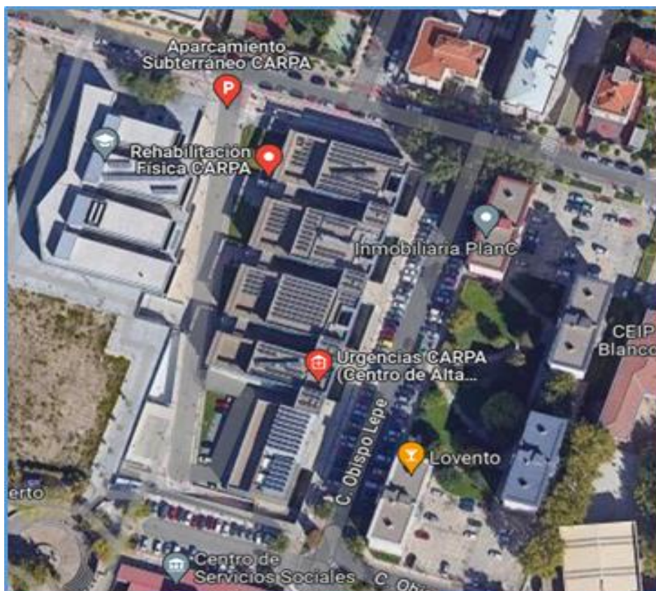
Vista aérea del C.A.R.P.A.