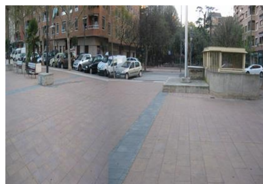
CENTRO DE SALUD DE ESPARTERO