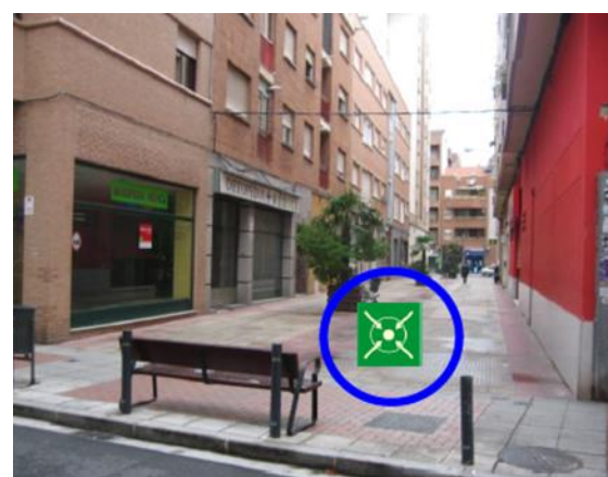
CENTRO DE SALUD DE LABRADORES