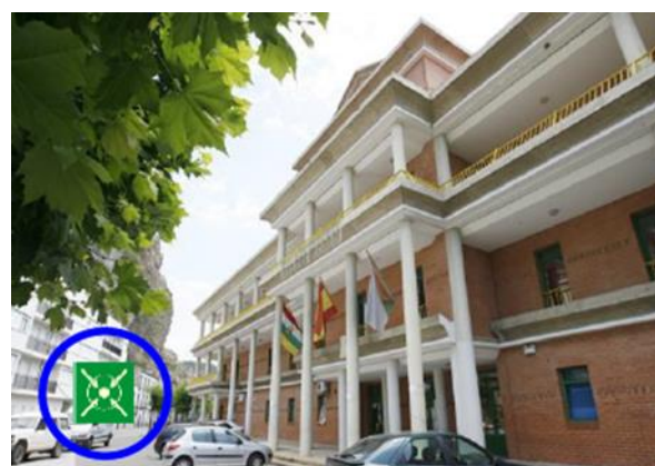
CENTRO DE SALUD DE CERVERA DEL RIO ALHAMA

PUNTO DE REUNIÓN: Calle Plaza la Constitución