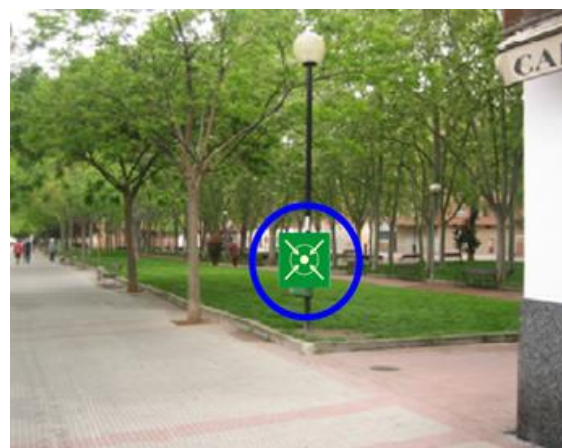
CENTRO DE SALUD DE JOAQUIN ELIZALDE

PUNTO DE REUNIÓN: Zona verde c/San Millán