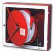
BIE 45 mm.