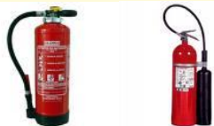
POLVO POLIVALENTE ABC