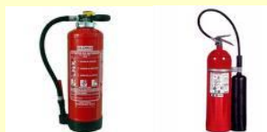
POLVO POLIVALENTE ABC