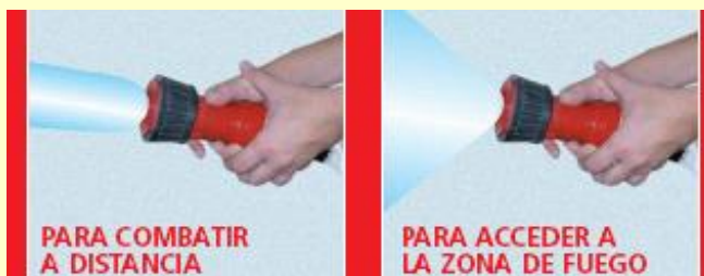
Más alcance. Menos Eficaz