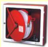
BIE 45 mm.